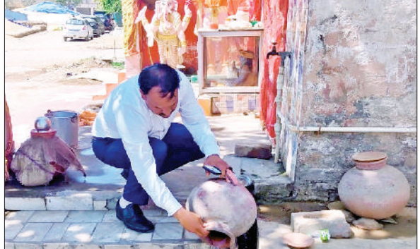
मंदिर के पास भरे पानी के बर्तन को खाली करते स्वास्थ्य विभाग की टीम।