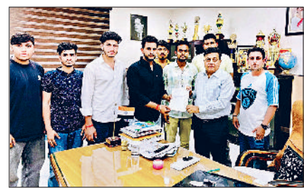
जींद। वीसी तथा रजिस्ट्रार को ज्ञापन सौंपते छात्र।