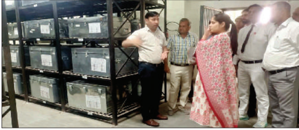
जीद। स्टॉप रूम की प्रक्रिया को जांचते अधिकारी।

लोकसभा आम चुनाव के दौरान जिला में प्रयुक्त होने वाली इलेक्ट्रॉनिक वोटिंग व वीवीपैट मशीनों का पहला रेंडमाइजेशन वीरवार को लघु सचिवालय सभागार में हुआ। रेंडमाइजेशन की प्रक्रिया जिला निर्वाचन अधिकारी मोहम्मद इमरान रजा की उपस्थिति में पूरी की गई। रेंडमाइजेशन की प्रक्रिया विभिन्न राजनीतिक दलों के प्रतिनिधियों की उपस्थिति में हुई। इस मौके पर अतिरिक्त उपायुक्त एवं जिला के स्वीप नोडल अधिकारी डा. हरीश वशिष्ठ, जिला