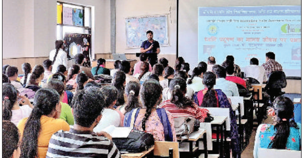
जीद। कार्यक्रम में विचार रखते हुए वक्ता।