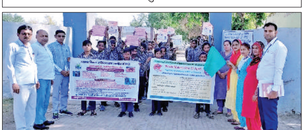
विश्व मलेरिया दिवस पर ईटलखुर्द में जागरूकता रैली निकालते बच्चे।