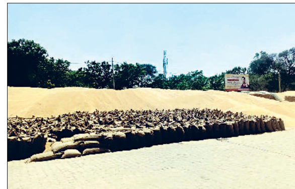
जुलाना। नई अनाज मंडी में लगे गेहूं के ढेर।

उद्याना। खतर सब याई पर शुक्रवार दोपहर तक अगर उद्यान की रफ्तार तेज नहीं हुई तो आदती मंडी गेट के ताले लगा कर इनकी चौबीस मार्केट कमेटी सचिव को सौंपे। खतर सब याई प्रधान राजा खतर ने बताया कि आदतियों की मीटिंग हुई। कई दिनों से उद्यान की रफ्तार काफी धीमी है। इसको लेकर कई बार प्रशासन को अवगत करवाने के बाद भी कोई सुनवाई नहीं हो रही है। ऐसे में आदतियों ने फैसला लिया है कि अगर शुक्रवार दोपहर तक ट्रान्स्पॉर्टर द्वारा उद्यान की रफ्तार को नहीं बढ़ाया गया तो मंडी के गेटों पर आदती ताले जड़ कर उनकी चाबी उद्यान मार्केट कमेटी सचिव को दे देंगे। जब उद्यान तेजी से नहीं हो रहा तो मंडी में आदतियों के बैठने का क्या फायदा है। उन्होंने कहा कि दो लाख 25 हजार से अधिक गेहूं के बैगों की खरीद हेफेड, डीएफएससी द्वारा की गई है। तीन लाख के करीब बैग गेहूं के सीजन में खतर सब याई पर आते हैं। जो उद्यान की रफ्तार है वो काफी कम है। हर रोज कम से कम 20 हजार बैगों का उद्यान होना चाहिए जबकि उद्यान 10 हजार बैगों का भी नहीं हो रहा है। उद्यान नहीं होने से किसानों के खाते में पेमेंट आने में देरी हो रही है। गेहूं के बैगों की रखवाली आदतियों को करनी पड़ रही है।