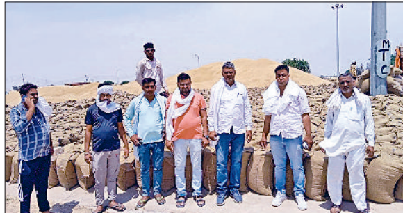
खतर सब याई आदतियों की बैठक, लिया फैसला