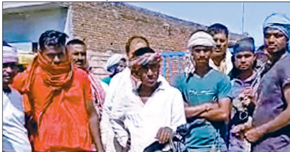
गुहला चीका। रामथली परचेज सेंटर पर अपनी समस्या बताते मजदूर।

के लिए मंडियों में बैठना पड़ रहा है। दूसरी तरफ मजदूरों ने भी शिकायत करते हुए कहा कि दर्जनों मजदूर खाली बैठे हैं नतीजतन उन्हें रोटीयों के लाले पड़ गए हैं क्योंकि यदि वे वाहनों में गेहूं की बोरियां लोड करेंगे, तो ही उन्हें दिहाड़ी मिलेगी। इस बीच आदतियों, किसानों व मजदूरों ने खरीद सेंटर का ताला लगाकर मांग की है कि जब तक कोई बड़ा अधिकारी उनकी समस्या को सुनने के लिए मौके पर नहीं आएगा तब तक वे सेंटर का ताला नहीं खोलेंगे। क्या कहना है मार्केट कमेटी सचिव का इस सम्बन्ध में मार्केट कमेटी के सचिव सतवीर रविश से बात की तो उन्होंने कहा कि किसानों व आदतियों की शिकायत पर सम्बन्धित ठेकेदार को आदेश दिए गए हैं कि वह गेहूं के कट्टों को जल्द उठवाए और मंडी को खाली करें ताकि किसी को कोई परेशानी ना आए। उन्होंने कहा कि जल्द ही उद्यान का कार्य तेज हो जाएगा।